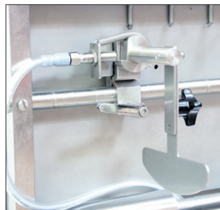
Части длина остановки

Устройство может использоваться в сочетании со всеми обычными наполнителями. Размер порций подаваемых из наполнителя определяется клипимпульсом или установленной на клипмашине длиной остановки.