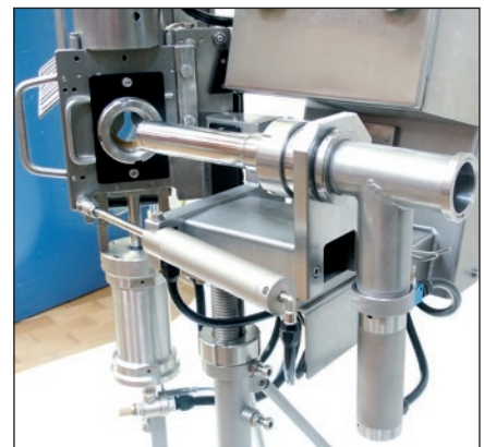
Pompe de recirculation