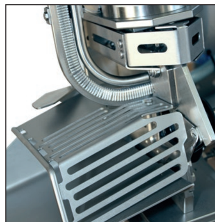
La sécurité d'abord, même avec des débits élevés.