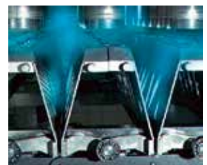
巧妙联用超压与向下流体力量

AsepTec 灌装机是市面上最灵活方便的灌装系统，能够灌装高低粘度，且所含颗粒尺寸达 9x9x9mm 的产品。容器尺寸和产品配方更换可在无菌条件下进行。