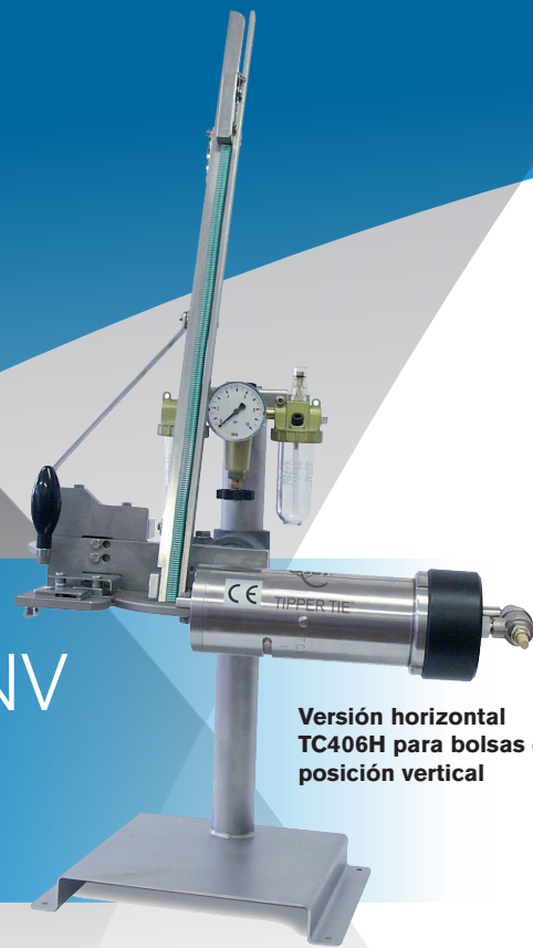
Versión horizontal TC406H para bolsas en posición vertical

Las clipadoras de mesa de la serie TCV se emplean allí donde se precise un cierre absolutamente seguro. Con estos equipos se sellan embutidos, carnes avícolas y de caza, moluscos, así como también carne fresca y quesos envasados.