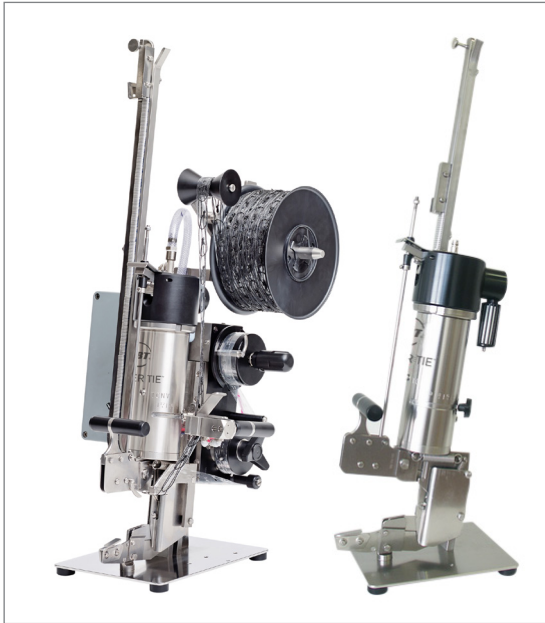
Modelo TCNV con enhebradora automática de lazos y modelo TCNV con cuchilla neumática

y todas las otras tripas de uso corriente.