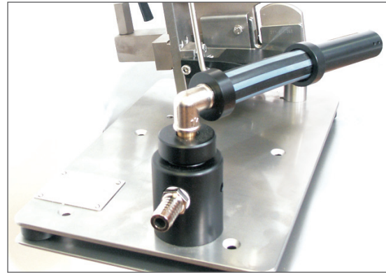
Tubo de aspiración orientable para productos envasados al vacío