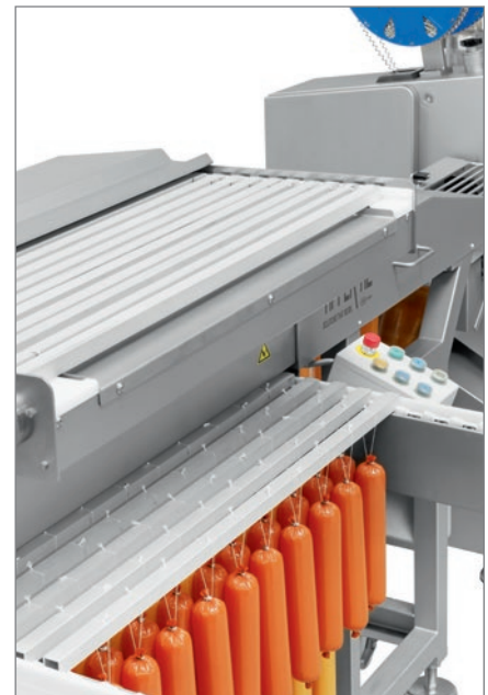
Das motorisierte Rauchstockmagazin fasst 22 Rauchstöcke.

Durch die Lieferung des kompletten Systems von einem einzigen Hersteller – SwiStick, Doppelclipper, Clips, Schlaufen und Etiketten – wird eine störungsfreie Produktion gewährleistet und die Sicherheit erhöht. Legierung, Profil und Maßgenauigkeit machen die Clips von TIPPER TIE zum Industriestandard für sichere Verpackungen. Die Produkte können durch verschiedene Kennzeichnungsmethoden individuell etikettiert werden. Farbige Clips oder Schlaufen, geprägte Clips oder eingeclippte Etiketten sind hervorragende Mittel zur Produktidentifizierung.