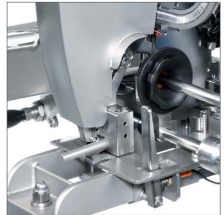
Tasthebelsteuerung für optisch gleich große Portionen.