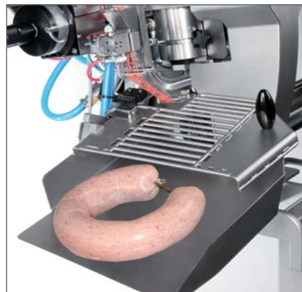
Speziell für Ringprodukte wie Fleischwurst, Ringsalami, Blut- und Leberwurst.