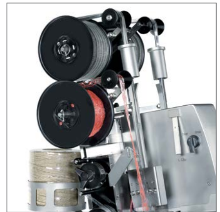
Spulenclips, Bandschlaufen und Fadenspender für eine effiziente Produktion.