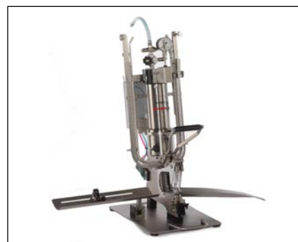
DCM с опорной плитой

Управление машиной KDCM осуществляется с помощью современного цифрового дисплея.