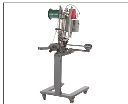
DCM с нижней тележкой