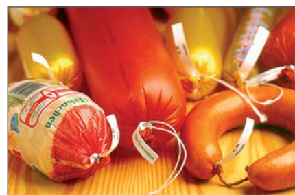
Продукты с этикетками и петлями