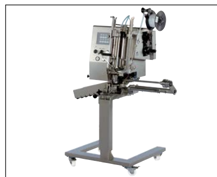
KDCM с электронной системой управления