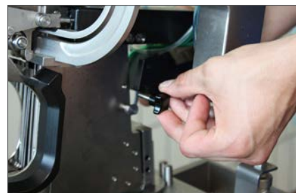
Удобство в обслуживании: смена ножей из инструментов