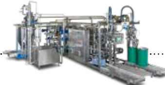
READYGo™ ASEPTIC MONOBLOCK