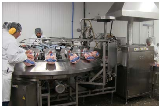
Rota-Matic легко интегрируется в существующие упаковочные системы и обеспечивает непрерывную высокоскоростную вакуумную упаковку.

“ Поддерживается стабильный вакуум, не зависящий от того, как размещается продукт. Кроме того, на этом станке очень легко обучать операторов.