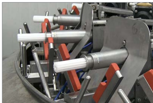
Рифленые тефлоновые® головки для длительного сохранения своих характеристик.