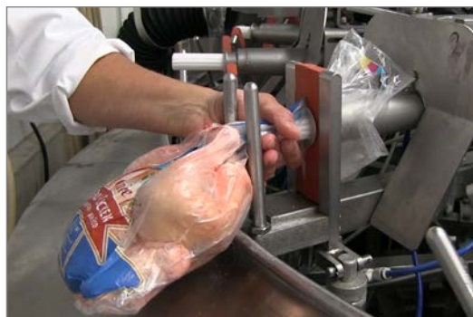
Простота управления и продуманный дизайн служат для плотной упаковки и комфорта в обслуживании.