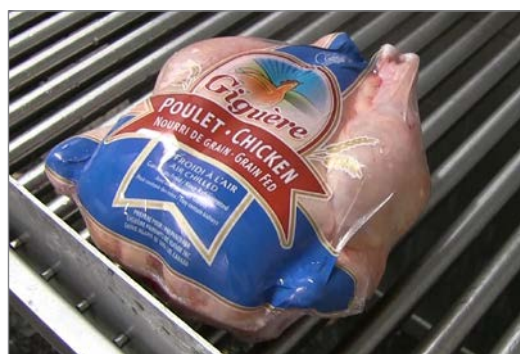
Плотно запечатанные целые куры, готовые для продажи в мясной витрине.

“ Прошло некоторое время, прежде чем мы привыкли к этому, но теперь все работает просто замечательно. Rota-Matic – наш ‚ребенок‘. ”